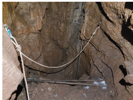
partenza P 35

Partenza doppia per doppia campata, due coppie di R, 3,5 m sotto, 2 R comodi per il I° fraz, poi altri 7 m altri due R per il II° fraz, ancora 21 m e si arriva sul fondo. Corde da 50m